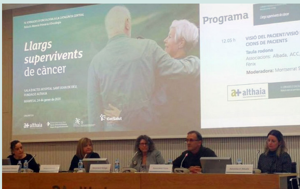
Taula rodona d'entitats participants a la Jornada

Les IV jornades d'oncologia organitzades per la fundació Althaia, s'han centrat en els llargs supervivents de càncer, iniciant un nou projecte per atendre aquest col·lectiu, cada vegada més nombrós i amb necessitats específiques que cal donar-hi resposta.