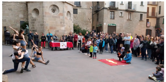
Moment de la celebració

L'Escola de Dansa de Solsona ha donat relleu a la celebració del Dia Mundial Contra el Càncer a l'inici i en la cloenda de la convocatòria amb l'actuació dels joves ballarins del centre.